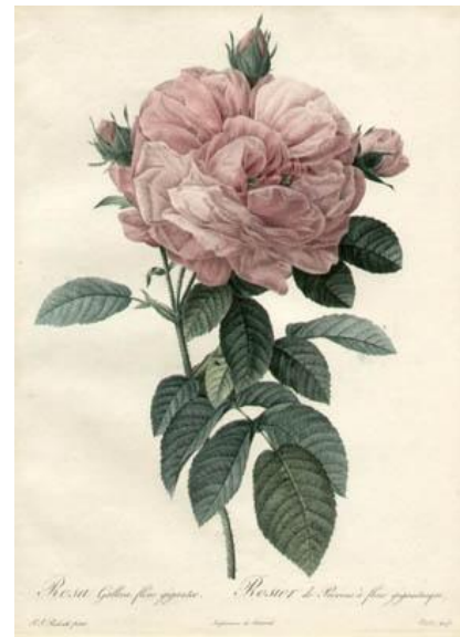
Illustraties van Pierre Joseph Redoute