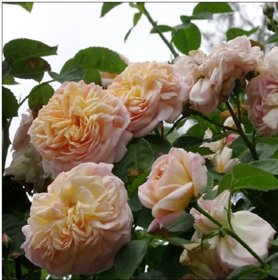
Noisette roos 'Gloire de Dijon'