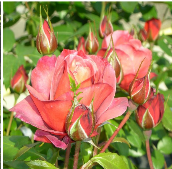
Floribunda / trosroos 'Hot Cocoa'