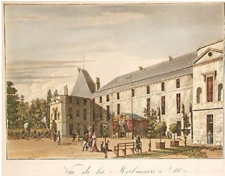
Chateau de Malmaison

Napoleon's vrouw Josephine hield heel veel van rozen en legde een collectie rozen aan in de tuin van Chateau de Malmaison van meer dan 250 soorten. In deze tuin werkte later Pierre Joseph Redoute (een botanisch illustrator) aan zijn collectie waterschilderijen genaamd 'les rose'. Dit wordt nog steeds gezien als van de beste collecties van botanische illustraties.