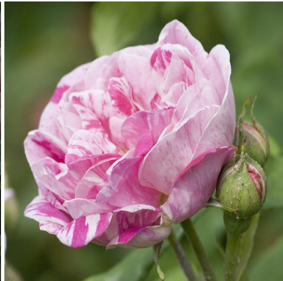
Bourbon roos 'Honorine de Brabant'

In 1862 werd Rosa multiflora vanuit Japan geïntroduceerd. Kruisingen met deze bloemrijke soort leiden een tiental jaar later tot een nieuwe groep rozen: De polyantha rozen. Deze rozen bloeien met trossen met kleine bloemen. In 1910-1920 leiden kruisingen van polyantha rozen met theehybriden tot een nieuwe groep: de floribundas. De groep heeft grotere bloemen in trossen. Onze huidige trosroos was geboren. Er wordt gezegd dat Gruss an Aachen de eerste feitelijke floribunda was.